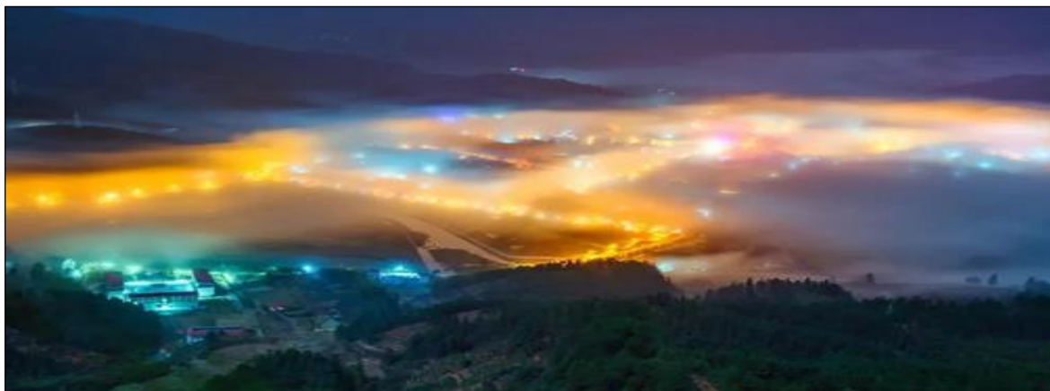
图 2. 茶乡灯火